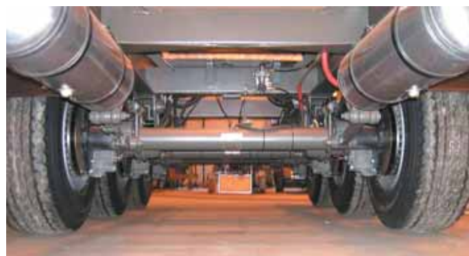
Tässä näkyy hyvin levyjarrujen antama yllättävän hyvä maavara. Renkaat ovat Bridgestone 385/65 R 22,5. Ilmasäiliöinä kaksi 60:n litran alumiinisäiliötä

vaunua. Entinen ilmajousinen muuttui Liteflex -komposiittijousiseksi. Muiden kevennysratkaisujen kanssa uusi 12 -metrinen puoliperävaunu on peräti 750 kiloa kevyempi. Se painaa vain 4.150 kiloa. Kaksi-akselisen veturin kanssa yhdistelmän omapaino on 10.200 kiloa eli vähemmän kuin pelkkä vetoauto normaaliajossa.