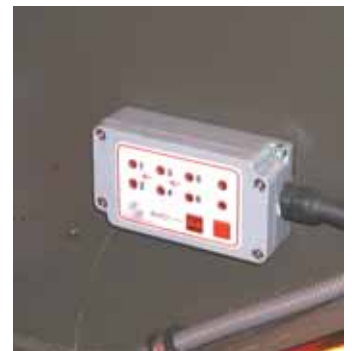
Jarrupalojen kulumisesta kertovat merkkivalot.