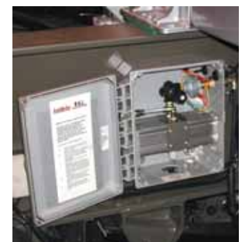
Paineentasausjärjestelmän keskusyksikkö on hyvin suojatussa paikassa rungon sisäpuolella.